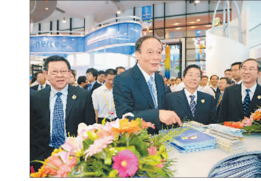
中共中央政治局委员、国务院副总理王岐山在自治区党委书记、自治区人大常委会主任郭声琨,自治区党委副书记、自治区主席马飏等领导陪同下,视察博览会展馆广西农村信用联社展位,对广西农信社学习贯彻党的十七届三中全会精神,深化改革、加快发展,更好地服务“三农”提出了殷切的期望。