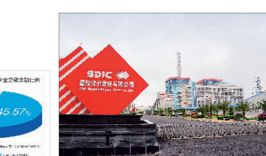
广西农村合作金融机构大力支持重点企业发展。