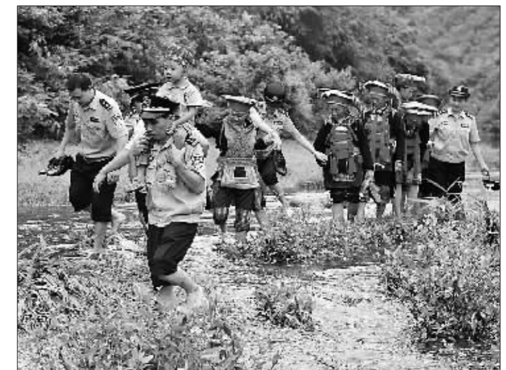
转变作风,开展亲民利民活动。