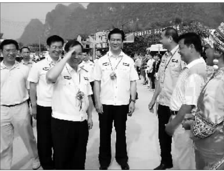
自治区公安厅党委副书记、常务副厅长文起涛,厅党委委员、政治部主任骆振严来到都安瑶族自治县大定村驻村警务室,检查警民关系的构建工作。

全区各级公安机关还结合开展“一教育三整顿”活动,进一步树立求真务实、积极进取、严格执法、热情服务的良好警风;队伍中一些长期以来得不到解决的顽症得到纠正,民警在理想信念、思想、作风、纪律等方面的突出问题得到解决;继续推进“大走访”爱民实践活动,对影响社会稳定的问题进行大排查,在派出所建立统一规范的调解室,推行“三级限时调解”工作机制,继续推进“五级五接访”和“公安信访超市”新机制,实施化解矛盾纠纷、和谐警民关系“十百千”工程,把履行好职责,服务好群众为己任,深入群众调查研究,与群众交心谈心,了解民情,尊重民意,最大限度地增加和谐因素,最大限度地减少不和谐因素。