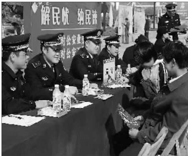
开门纳谏,积极听取群众意见。