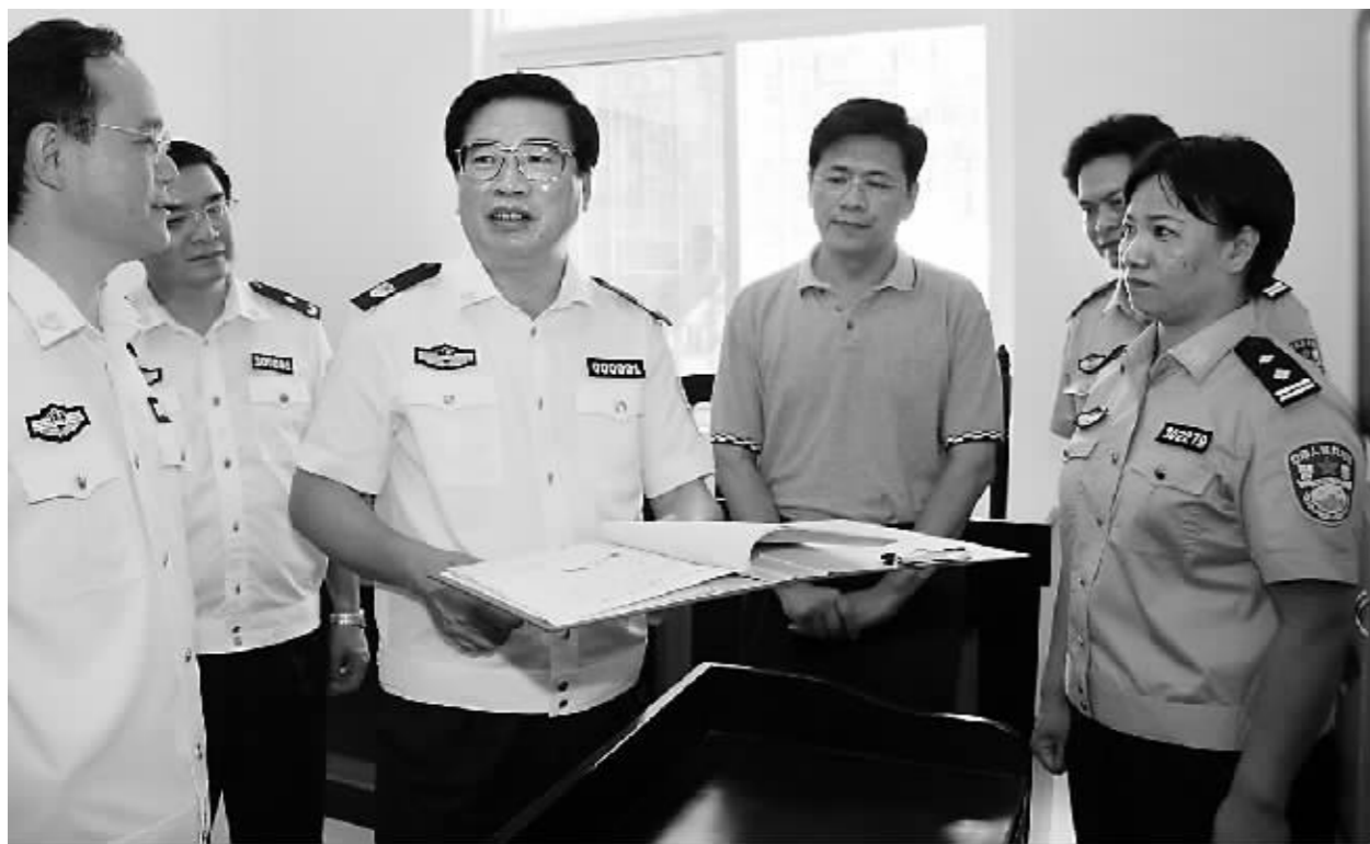
自治区副主席,自治区公安厅党委书记、厅长梁胜利深入基层开展公安队伍建设调研。

想、整顿作风、整顿纪律”为主题的“一教育三整顿”活动,各市、县公安局对352个突出问题立项整改,实施专项整治。仅公安交警系统就开展公开评警活动429次,落实便民措施704条,为群众解决问题3100件。